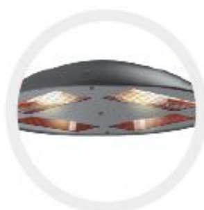
4x 1400W 4x 2000W