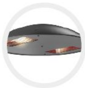
2x 1400W 2x 2000W