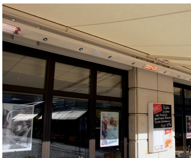
Den knapt 100 meter lange SOLAMAGIC varmeløsning med indbygget lys- og lydanlæg ved luksushotellet Hilton i Dresden.