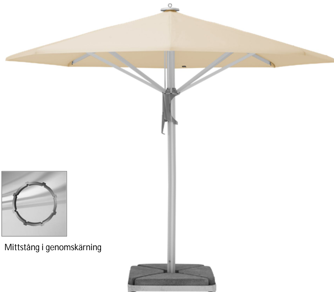
Mittstång i genomsnitt