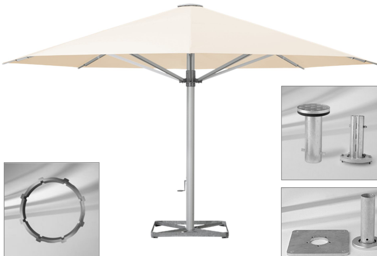
Mittstång i genomskärning